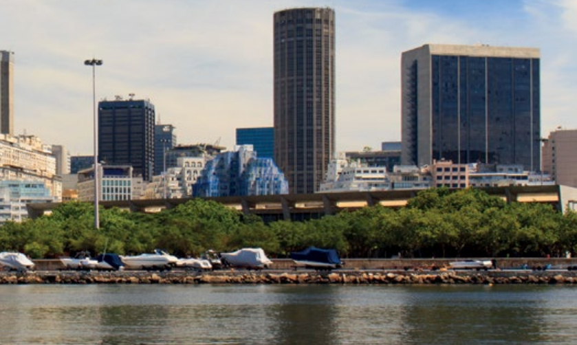
Widok na centrum Rio de Janeiro